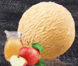
Sorbet Hochstamm Süssmost